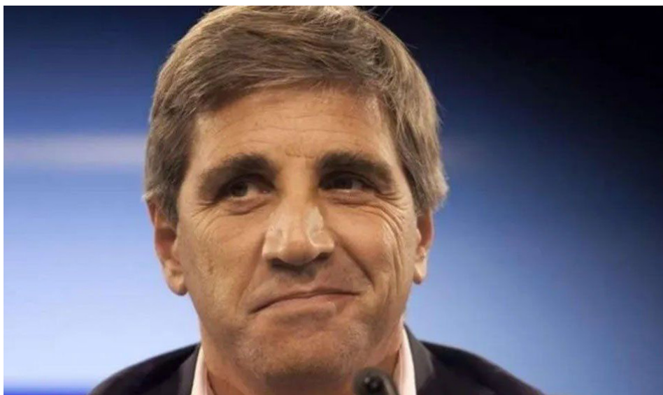
Luis Caputo, futuro Ministro de Economía

Pero a la par de sus anhelos de liberar totalmente la economía y atacar las condiciones y derechos laborales, el eje de su programa es satisfacer las demandas del FMI, cabeza negociadora de los fondos buitres usureros. Y declaró: “Agitar el fantasma del default parece una irresponsabilidad”, “...cumpliremos nuestros compromisos y honraremos la Deuda”. Entre diciembre 2023 y febrero 2024 vencen unos U$S 6.200.- millones (FMI U$S 3.700.- U$S 1.500 millones a fondos buitres privados, U$S