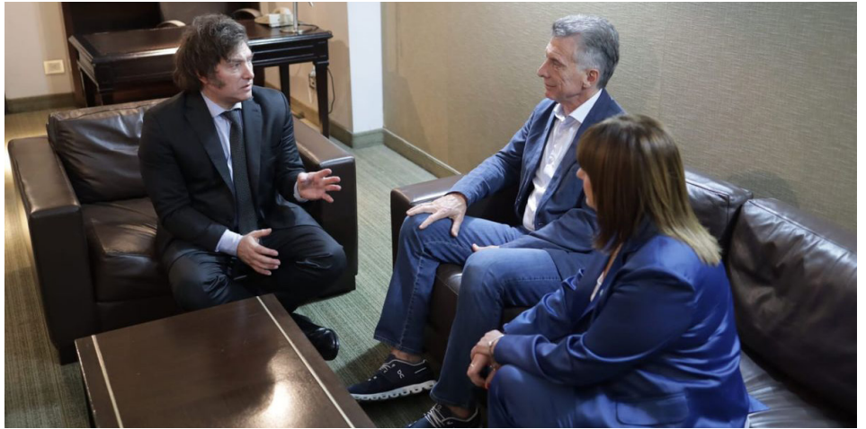
Javier Milei, Mauricio Macri y Patricia Bullrich

Eliminará subsidios a la energía, al transporte y demás, y permitirá aumentos en la luz, el gas, el boleto, provocando que nuestro salario quede aún más reducido. Una resolución del Poder Judicial dejó sin efecto el decreto que hacía de Internet un servicio esencial, de utilidad pública, por lo que es de esperar un aumento importante también en esa área.