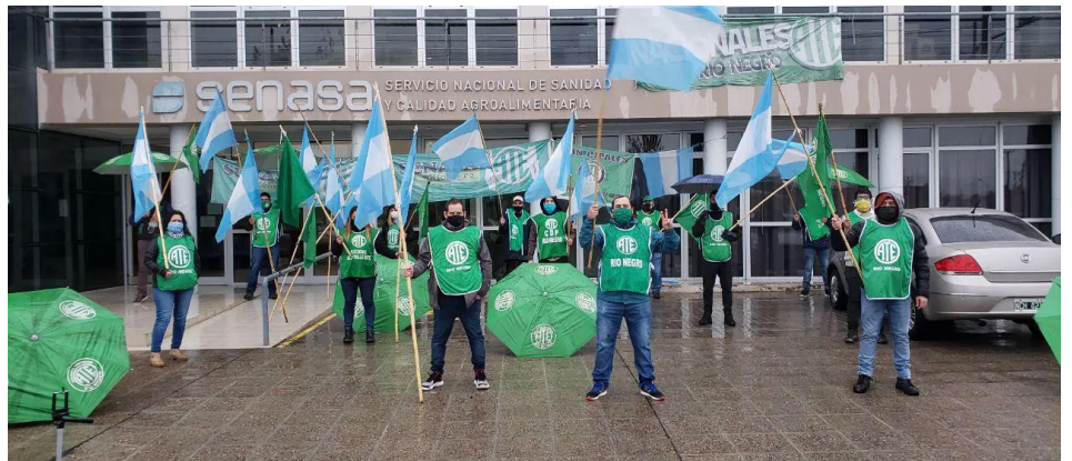
Trabajadores del SENASA en lucha

Por otro lado, la mayoría de los dirigentes peronistas llaman a dejar gobernar. Algunos, como Daniel Scioli, podrían hasta ser parte del nuevo Gobierno. Así como frente al macrismo le