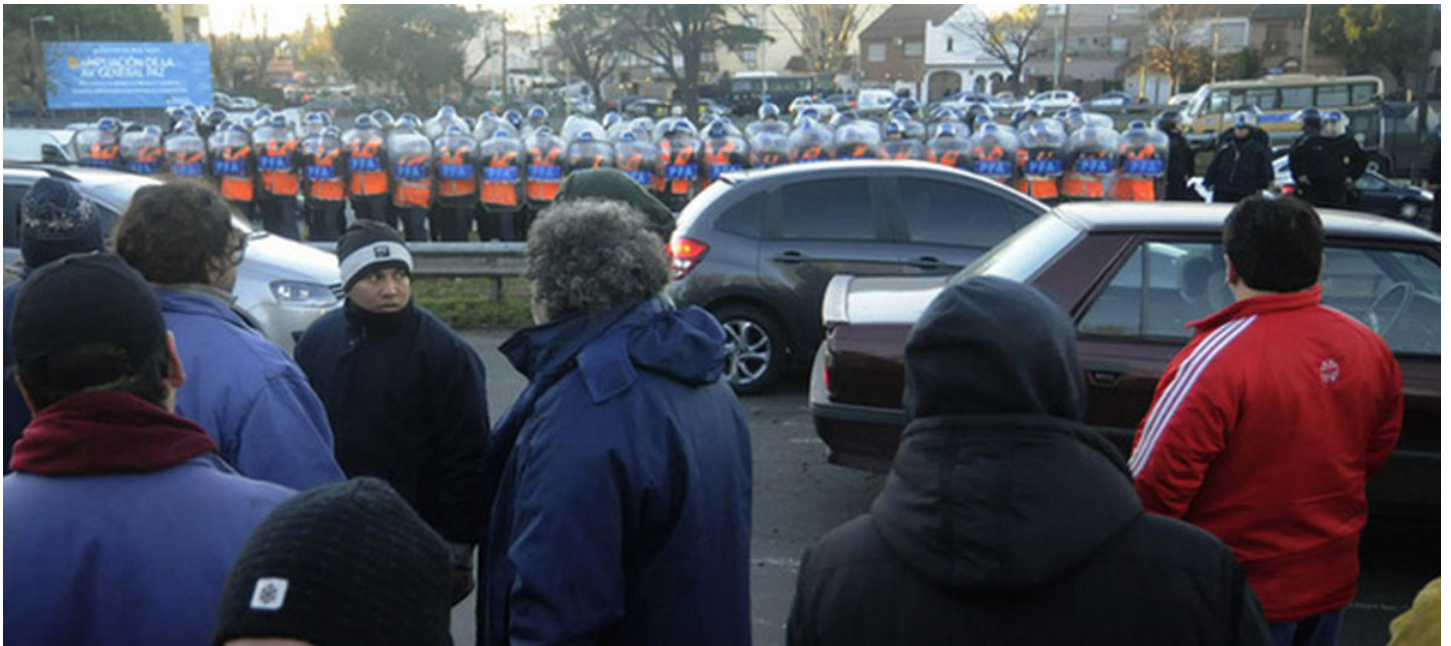
Toma de EMFER TATSA en el 2014 provincia de Buenos Aires

Después de la victoria de Javier Milei como presidente ya se van anunciando las medidas que golpearán a la clase obrera después del 10 de diciembre. Privatizaciones, recortes en el Estado, la posibilidad de no pago de aguinaldos e incluso empresas automotrices abriendo la lista de retiros voluntarios, poniendo los despidos arriba de la mesa. En defensa de nuestros puestos de trabajo y el sustento de nuestras familias debemos salir a enfrentar estos golpes de la burguesía.