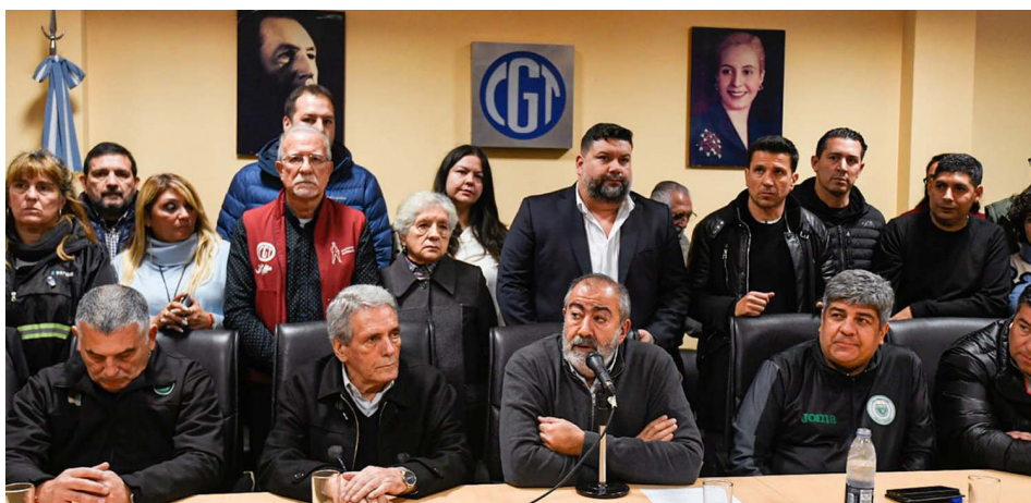
Dirigentes de la CGT

Es evidente que para estar preparados necesitamos nuevos dirigentes en los Sindi-