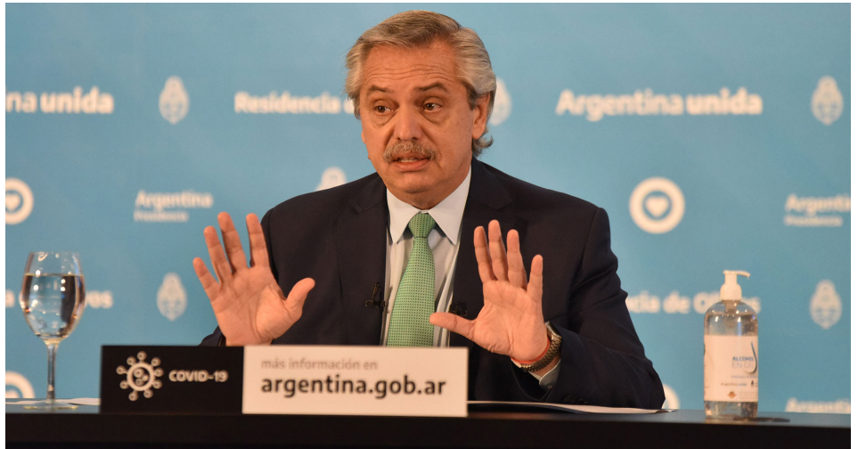
Alberto Fernández en conferencia de prensa

Y así siguió. El Gobierno acordó con el FMI pagar el préstamo que tomó Macri, tan criticado y denunciado, incluso planteando que era ilegal. Y además, continuó