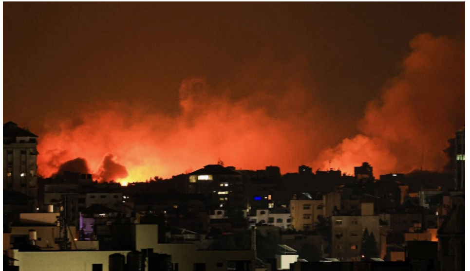
Bombardeos a la Franja de Gaza

La tregua permitió el canje de 105 israelíes en manos de Hamás por 240 mujeres y menores de edad presos en cárceles de