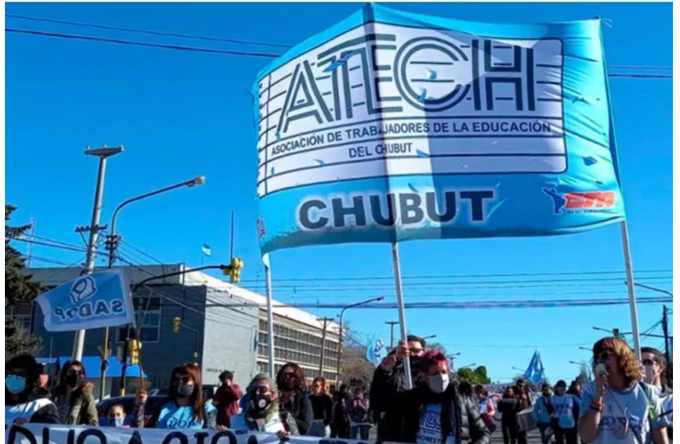
Movilización de trabajadores y trabajadoras estatales en Chubut

En su ofensiva sobre la clase trabajadora el Gobierno de Arcioni no estuvo solo: fue acompañado por la totalidad de los partidos patronales que tenían y tienen representación en la Legislatura: el peronismo, el PRO, el radicalismo y La Libertad Avanza. Todos le votaron los presupuestos recortados en Salud, Educación y Obra Pública que muestran como consecuencia a esta provincia saqueada y a la clase trabajadora y al pueblo pobre en pésimas condiciones de vida.