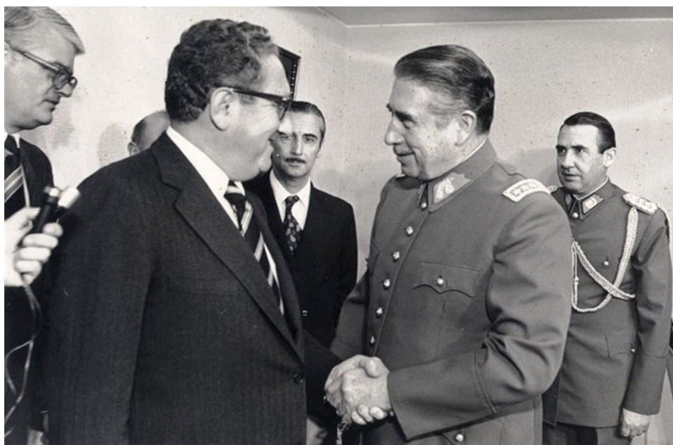
Henry Kissinger y Augusto Pinochet. Dictadura Militar en Chile 1973