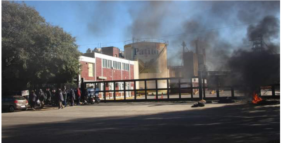
Entrada de empresa con piquete de trabajadores y trabajadoras

La Libertad Avanza tiene pocos legisladores y necesitó solo la billetera para comprar voluntades. Tampoco tiene que enfrentar a una casi nula dirigencia sindical y piquetera. La quietud gremial y falta de consistencia en algunas protestas, han sido fundamentales para avanzar en el “plan motosierra”, por un lado. Pero también la complicidad de los dirigentes políticos del peronismo en todas sus vertientes, empezando por el Kirchnerismo, la Cámpora y demás expresiones provinciales. Solo de ese modo se está avanzando con el ajuste sobre las espaldas de la clase obrera con feroces ataques a su nivel de vida.