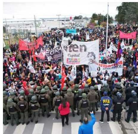
Movilización masiva de docentes en Neuquén capital

Esta dinámica del conflicto ha generado una crisis política tanto en la conducción