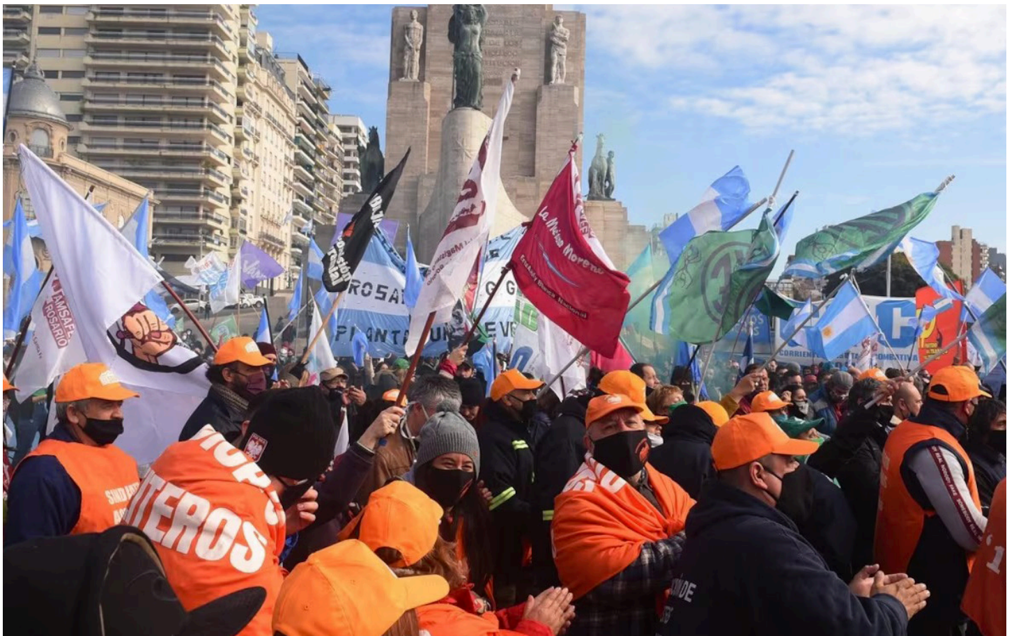
Trabajadores y trabajadoras del aceite en paro

Hacer propio este planteo como punto de partida de las mejoras salariales y laborales debe ser tomado por la vanguardia obrera y popular de Argentina.